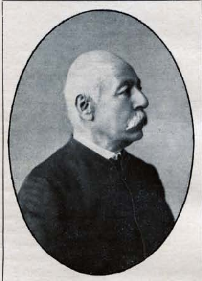
ՅՈՒՆԱՆՆԵՍ ՄԻՒՇԷՆՏԻՍԵԱՆ անգուգական Տղայերից ու Գրածուիչը

Չամչեան քերականութիւն , նաեւ կարգ մը «ուրիւն»ներ որոնք ձարտասանութեան ու Տրամաբանութեան պայմանադրական կանոններու շուրջ կը դառնային : Պատահին Յովհաննէս ատոնցմով ջրաւիճանանայով զիտութեան մասին ունեցած խոր հակումին գոնացում կու տայ , զիշերները տունը՝ զիտական իր հօրմէն երբեմն դասեր առնելով . օրինակի նամար՝ զաւար մը բափել և պարունակեալ նեղուկը հաշուել . « օգրան » կոչուած գործիքով իրրիֆա առնել» և ժամը քանի՛ն ըլլալը գիտնալ , իւրաքանչիւր օրուան արեւածագը գտնել և դեռ խնդ մը հաշուական գուարճայիքներ : — «Տղայ հասակես ի վեր (կ'ըսէ իր ինքնակենսագրութեանը մեջ զօր 1877 ին պատրաստած է Պետութեան առաջարկով) , մեծ գրասանքս էր մեղրամոմէ կերպ կերպ բաներ շինել , ալբել ու նօրէն շինել» : Չեռարուեստի սերն այսպէս կանուխէն շեշտուած է իր մեջ ու զինք վերջ ի վերջոյ իր փառքի ու հուշակի գենիքը բարձրացուցած , շնորհիւ մանաւանդ իր ձեռներեց ոգիին , յարատեւ ու մտաղիւր աշխատութեան և կամքի աննուաճ կորովին : — Մեղրամոմով պարագումի մանկուակ այս դրուագը ետքէն տուն տուած է Յ. Պարոնեանի , գրանկարելու նամար զինք իր «Ազգային Չոյեր»ին մեջ՝ կարի երգիծախառն ոճով մը :