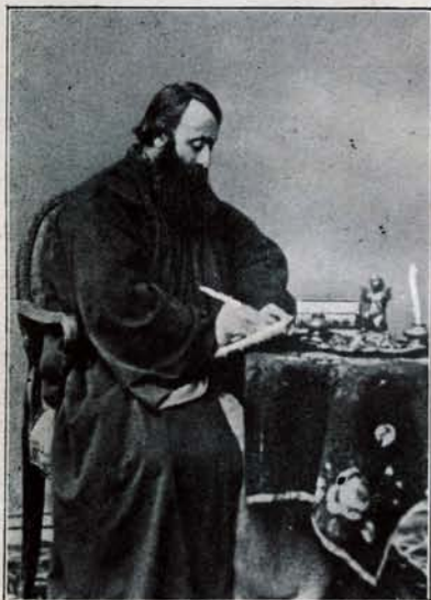
ԽՐԻՄԵԱՆ ՀԱՅՐԻԿԻ Երիտասարդութիւնը

գաւորաց վարձարան մը և տպարան մը նախատեսել նոն : Խաւարամիտ միաբաններու նախա- աւակութենէն վնաս՝ կը նարկադրուի Պօլիս անցնել կրկին, քարոզիչ կարգուելով Սկիւտարի