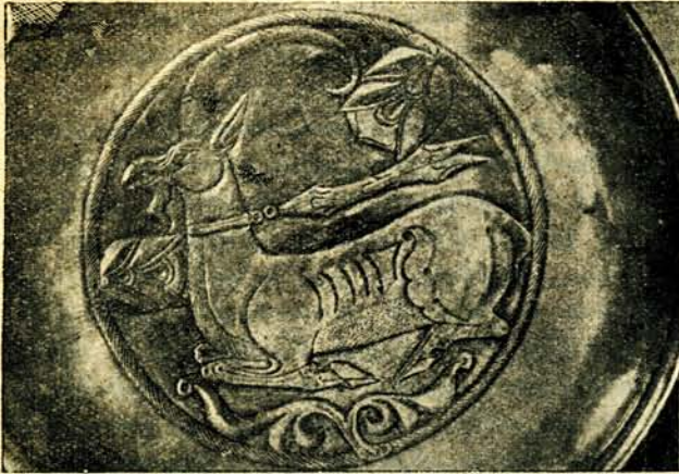
Սասանյան արծաթի դործ. Պատկեր 77.

մինք կարող ելինք ավելի ընդարձակել այս ցուցակը, մասամբ միայն նամանություն և բերում Դիարբեքերի