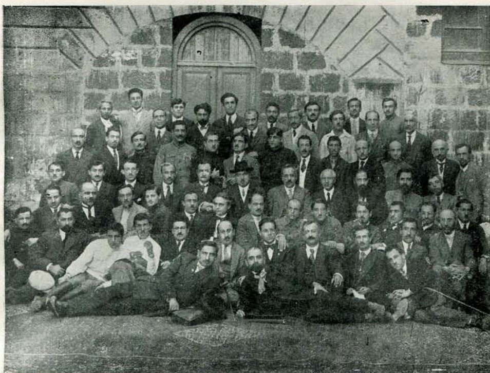
Հ. Յ. Գ. ՑՐԳԻ ԸՆԴՀԱՆՈՒՐ ԺՈՂՈՎՐ