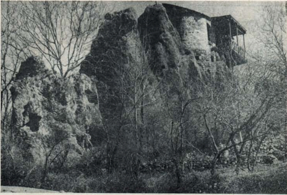
Գլուղացու տուն ժայռի գլխին. Հին Գորիս: