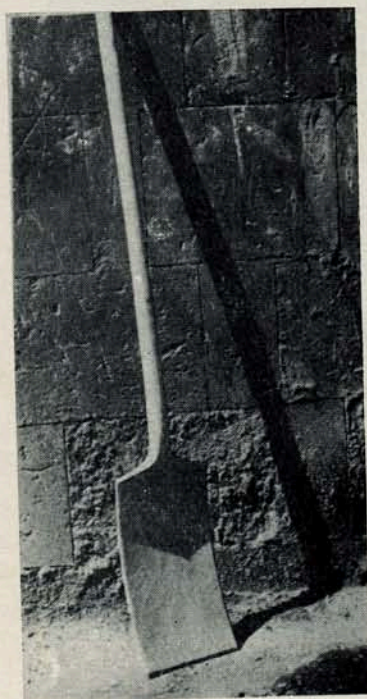
Թի—կալ շրջելու և շեղ Էրնէլու գործիք: