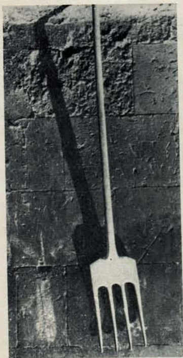
Քմէլի—հօսելի կալ շրջելու կամ Էրնէլու գործիք: