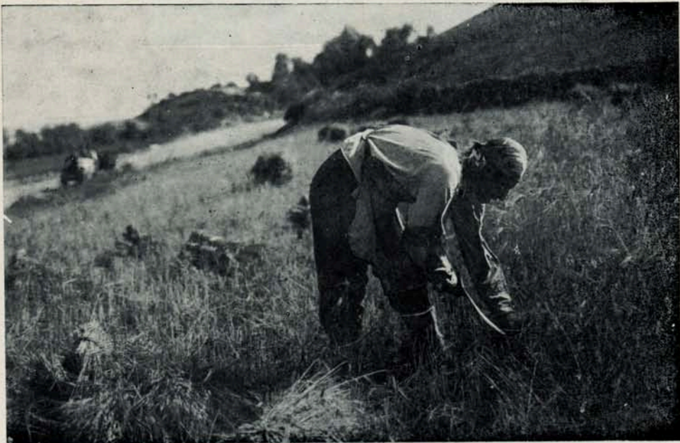
Մանգաղով հունձ անող. Գորիս: