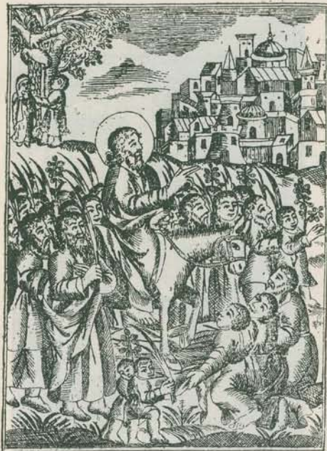
թ. 27. Տոնացոյց 1774ի, էջ 76.